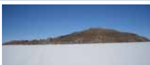
Dal Cile alla Bolivia tra lagune e salar 9/23 agosto