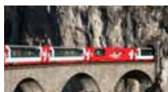
Il Bernina Express d'estate 17/19 giugno