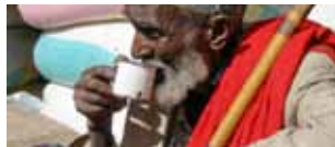
Etiopia: la rotta storica dell'altipiano 25 ottobre/4 novembre