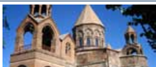
I monasteri tra i monti dell'Armenia 30 settembre/8 ottobre