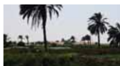
Il Cairo e l'osai del Fayum 17/24 marzo