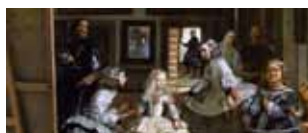
Madrid: Arte e musei 24/27 febbraio