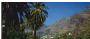
Le Canarie occidentali La Palma, La Gomera e il Teide 4/11 dicembre