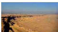
Gerusalemme e il deserto del Negev 4/9 marzo