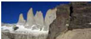
Dall'Argentina al Cile e viceversa Patagonia, Paine e capo Horn 28 novembre/10 dicembre