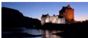
Scozia, castelli e brughiere 16/23 luglio