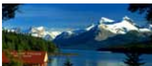
Canada: Inside passage e montagne rocciose 9/22 luglio