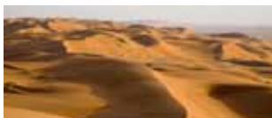
L'Oman dei sultani e gli Emirati 29 gennaio/8 febbraio