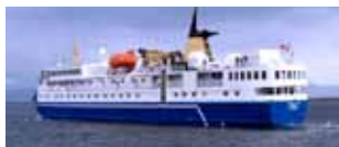
Spedizione in Antartide 5/15 gennaio