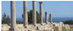
Cipro, una vacanza archeologica 20/27 maggio