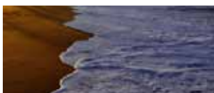
Sri Lanka: l'isola splendente 27 dicembre/8 gennaio