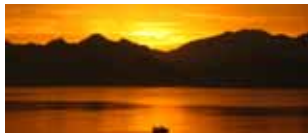
Le meraviglie della Lycia 7/14 maggio