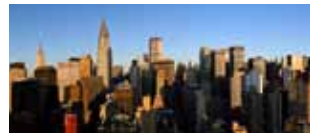
Pasqua a Chicago e New York 22/30 aprile