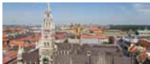
Monaco di Baviera: una città modello 10/13 novembre