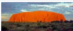
Gran parte dell'Australia 6/25 agosto