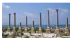
Libano, un patrimonio archeologico 9/15 marzo