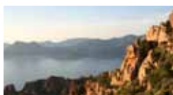
La Corsica tra mare e pinete 4/11 giugno