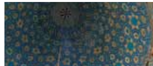
Iran: nuova e antica Persia 25 maggio/5 giugno