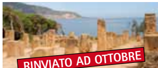
L'Algeria romana 2/9 aprile