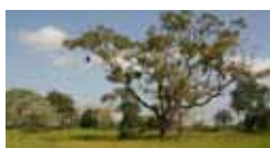
Senegal, il paese più allegro dell'Africa 4/14 marzo