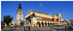
Cracovia e Leopoli 12/18 maggio