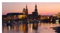
Dresda città delle meraviglie 24/27 marzo