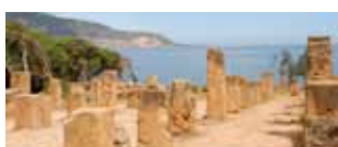
L'Algeria romana 9/16 ottobre