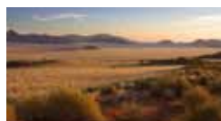
Namibia, il contrasto africano 18 /30 giugno