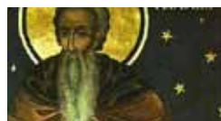
Bulgaria: crocevia dei Balcani 20/27 giugno