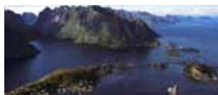
Le Lofoten e Capo Nord 28 luglio/4 agosto *Tour condiviso