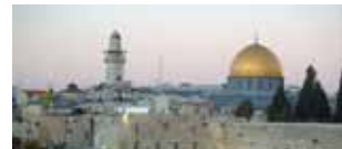
Israele: archeologia tra il deserto e il mare 26 ottobre/2 novembre