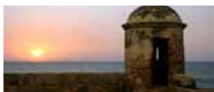
Una Colombia tranquilla 12/23 febbraio