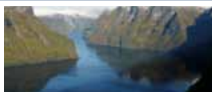
I fiordi della Norvegia 18/25 agosto *Tour condiviso