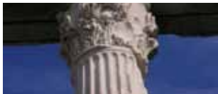
Albania: un paese sconosciuto 21/28 aprile