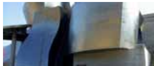
Bilbao, Cantabria e Asturias 22/30 aprile