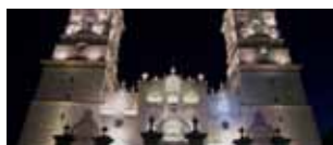
Il Messico Coloniale 27 dicembre/7gennaio