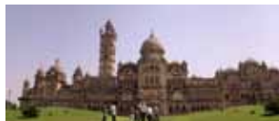
Templi del Gujarat, patria di Gandhi 28 novembre/10 dicembre