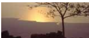
La Giordania: Petra e il Mar Morto 20/27 febbraio